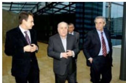
Zapatero y Touriño (PSOE)

Toda la PRENSA española ha callado ante los escándalos de explotación de Inditex contribuyendo a crear la imagen de Amancio Ortega como “hombre hecho a sí mismo”. Han sido periodistas franceses los más contundentes en la denuncia.