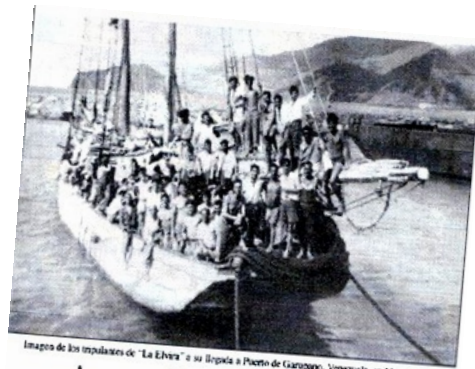
Imagen de los tripulantes de "La Elvera" a su llegada a Puerto de Guaymas, Venezuela, en Mayo 1949 Apresados en Venezuela 160 inmigrantes ilegales Canarios

Los españoles también fuimos emigrantes, y ahora de nuevo volvemos a serlo. Más de 300.000 españoles se han ido a causa de la “crisis”.